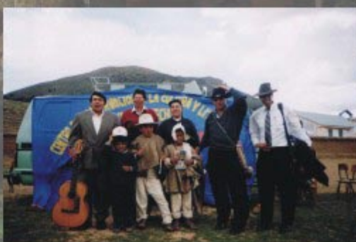
Grupos de interaprendizaje - GIA RUKUS - AZANGARO