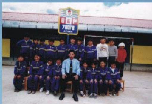
Niños y niñas rurales (Aora)