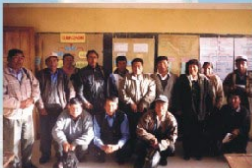
Docentes seleccionados EBI 2004 - Arapa, Chupa (Azángaro)