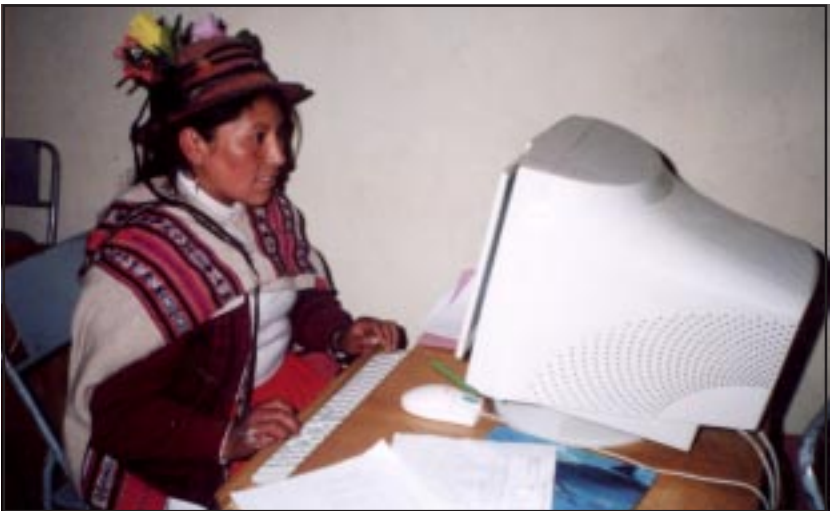
Señorita estudiante haciendo uso de la informatica (Ichuña - Moquegua)

Chayqa yachaymi, chay yachaypin uyarinanchispas, rimananchispas, qillqananchispas ñawinchananchispas, yuyaychakunanchispas tayta mamanchispa yachachisqan simipipuni, kay llaqtanchiskunapiqa huk simikunatapas rimallankutaq, chay simikunatapas yachayta atillanchistaq, chay raykun kunan qhipakunaqa yachay wasikunapiqa kastilla simita yachanallanchistaq, qhipamanqa kastilla simipi tukuy imatapis yachayta atillanchistaqmi.