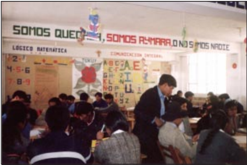
Jóvenes estudiantes en pleno proceso de formación en Educación Bilingüe Intercultural (ISP «A I B») - Moquegua

Kay Perú mama llaqtanchispiqa kanmi Mama Kamachikuy, kastilla simipiqa CONSTITUCIÓN POLÍTICA DEL ESTADO nisqa sutiyuq, chaypin kamachikuykuna kan, chunka qanchisniyuq kamachikuyninpin nin «.....ñawsa kaypas, ruqt'u kaypas, mana simiyuq kaypas chinkananmi. Kaqtaq kallantaqmi Imata yachanina kamachikuq « LEY GENERAL DE EDUCACION 28044 » chaypin inskay chunka kamachikuyñinpi (art. 20) iskay simipi, iskay kawsaypi q'ala yachaywasikunapi yachachina. May llaqtapipas yachachiyqa iskay simipi iskay kawsaypi kanan «Chaypachaqa ñuqallanchismanta ari kay runa siminchis maykama yachachiyas. Runa sunqu runakunaqa runa simipi ari yachay wasikunapipas (jardín, escuela, colegio, pedagógico y universidad). Tukuy imata yachachinanku.