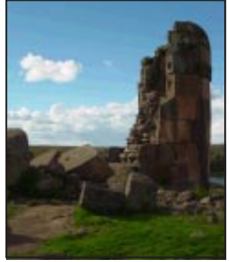
Sillustani - Puno

Runa simi, rimaq runakunaq llank'asqanmi kay munay chiqaskunaqa. Manan maypipas kanchu Kay hina kikin sumaq llank'asqakunaqa