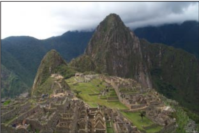
Machu Picchu - Cusco

ruraq kanku ichaqa paykunaq siminta rimaspa mana kastilla simitachu nitaq qhichwatachu, paykunaq simillankutapuni, kaqlataq ñuqanchispallaqtanchishina, waqcha nisqa kallantaq CHINA nisqa sutiyuq paykuna kunanqa kusatapuni hatarichkanku ,imaymanata ruraspa, imaymanata llank'aspa, lliwsuyukuna paykunamanta rimanku, yachachiyñinkupas wapullana, ichaqa paykunaq siminkupipuni, mana kastilla simipichu, nitaq qhichwapichu, nitaq aymarapichu, nitaq Ingles nisqa simipichu, paykunaq simillanpipuni rimakunku. Paykunaqa waputa yuyarinku tatankupa tatamamankuta, simintapas manapuni hayk'aqpas qunqankumanchu, chayri ima huchataq kanman runa siminchis rimayri, aswanpis munay kawsay kapunman, chhikaqa runa siminchistaqa mana mancharispa rimakunanchis, aswanpis waq simikunataqa yachaqaanallanchistaq imatachus rimanku, imatachus yachanku, imatachus munanku, chaykuna yachanapaq.