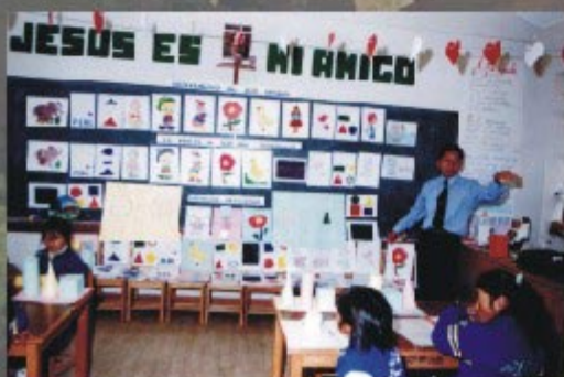
Niños y niñas aymaras

M.P. ARICO, I.P.E.S. J.R. F. EDWIN ARBULLU 251 - PUNO