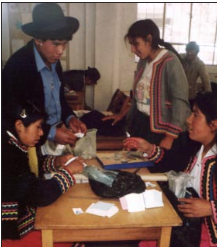
Jóvenes estudiantes del I.S.P. «Alianza Ichuña Bélgica» especialidad Primaria EBI - 2003, realizando trabajos de etnomatemática.