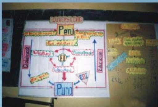
Proceso de Capacitación EBI 2004